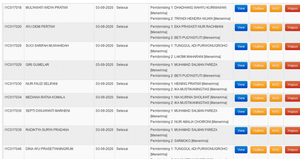
Gambar 6. Tampilan SIA versi 4.2 milik tim komisi skripsi untuk mengubah status skripsi mahasiswa yang telah menyelesaikan seminar hasil